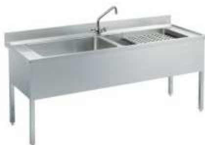
Su gambe 1 vasca con griglia porta tegami

Piano di lavoro in acciaio inox AISI 304 10/10 con pieghe salvamani ricavate su tutti i pannelli che migliorano la sicurezza sia durante il montaggio che durante l'utilizzo dell'apparecchiatura e garantiscono una maggiore pulibilità assicurata anche dalla presenza dei pannelli perimetrali che coprono interamente la vasca. Vasca in AISI 304 10/10 con dimensioni 1060x500x400 mm dotata di tubo troppopieno e piletta di scarico. Gambe in acciaio inox AISI 304 di sezione 40x40 Alzatina posteriore paraspruzzi, altezza 100 mm e spessore 13 mm. Piedini in PVC corpo innesto M.F.su tubolare 40x40 piedino regolabile a vite escursione 30mm Compreso di griglia posategami