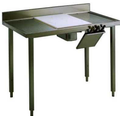
Tavolo lavorazione verdure

Piano di lavoro in acciaio 10/10 in AISI 304 di spessore 40 mm insonorizzato con piega salvamani sui bordi e sottoripiano rinforzato in pannello idrofugo. Alzatina posteriore paraspruzzi, altezza 100 mm e spessore 15 mm. Gambe quadre in acciaio inox AISI 304 con piedini in ABS e regolabili in altezza (40 mm) garantiscono un perfetto allineamento con gli altri elementi della preparazione. Il tavolo è grembiulato e dotato di vasca da 1070x320x180 mm. Ha, inoltre, in dotazione il foro per lo scraping per la lavorazione delle verdure e un tagliere in polietilene (810x230x25 mm) . Vasca sempre dotata di piletta di scarico e tubo troppo pieno. Elementi costruiti in conformità alle più restrittive norme internazionali relative ad igienicità e pulizia-